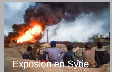
Exposition en Syrie

Des avocats sont contre la torture des enfants jihadistes français retenus dans des Camps de Syrie .